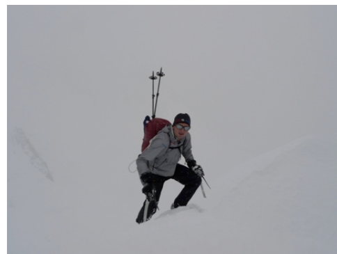
Ueli Aufstieg Lager 2