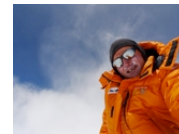
Ueli Steck Gipfel