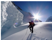
Ueli Steck Lager 2