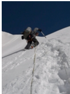
Ueli Steck Banana Ridge